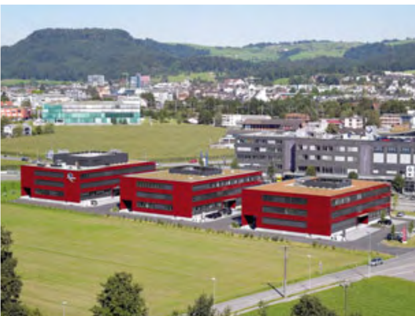
Büro- und Geschäftshaus IMPULS, Baar Architekt: Jego AG

Grundlage der einschaligen Versionen ist eine Glas tafel aus vetroDur (ESG), das hochwiderstandsfähige Einscheiben-Sicherheitsglas inklusive Heisslagerungstest (HST), das eine besondere Belastbarkeit gegen Stoss-, Schlag- und Biegebeanspruchungen sowie gegen thermische Einflüsse aufweist.