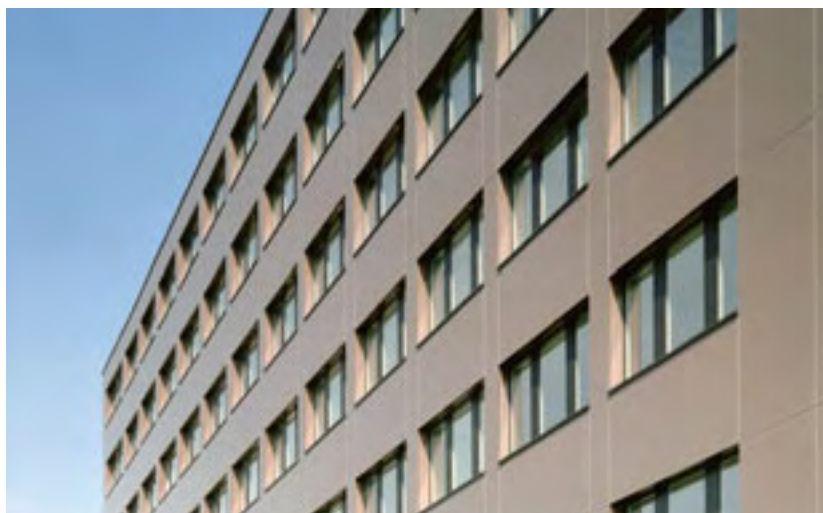
Dienstleistungspark Prisma, Steinhausen Architekt: Mozzatti Schlumpf Architekten AG

Die angegebenen Maximalabmessungen zeigen die Herstellmöglichkeiten. Sie haben nichts zu tun mit den aus der Anwendung bedingten Maximalgrössen.